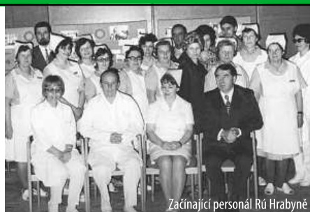
Začínající personál RÚ Hrabyně

Pátek 20. 11. 2015 patřil oslavám 40-ti let založení Rehabilitačního ústavu Hrabyně. Výročí tohoto zdravotnického zařízení si v dopoledních hodinách připomenuli bývalí zaměstnanci, kteří společně vzpomínali, jak nelehké byly začátky fungování rehabilitačního ústavu v Hrabyni. Účastníci zhlédli vystavené dobové fotografie, kroniky i nyníjší zrekonstruované prostory rehabilitačního ústavu.