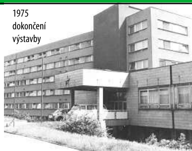
1975 dokončení výstavby