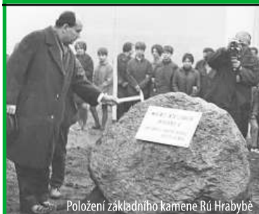
Položení základního kamene RÚ Hrabyně